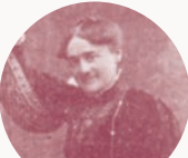
アンリエット・ルニエ