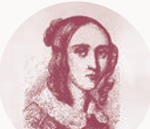
ルイーゼ・ファランク