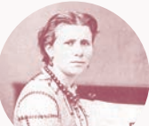
マリー・ジャエル